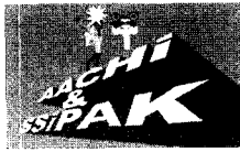
그림6. 아치와 시팍그림 (인물소개 형식)