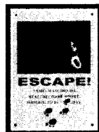
그림1. 마시마로 (상징형)

플래시 오프닝의 형식에는 자막의 연장으로 텍스트, 사운드(해설자의 목소리), 텍스트와 사운드 혼합형식, 배경 화면에 없는 것, 정지 이미지, 동영상 배경 화면으로 하는 형식, 그리고 플래시애니메이션의 서곡으로서의 형식이 있다. 그러나 플래시애니메이션 오프닝의 다양성의 폭이 점차로 넓어져 한 가지 이상의 혼합된 형식을 가지기 때문에 이러한 분류는 모든 플래시애니메이션 오프닝의 서문 형식을 설명하기란 어렵다. 국내 플래시 오프닝은 텍스트나 사운드 또는 텍스트와 사운드의 혼합형식을 오래 전부터 일반적인 오프닝의 형식이었으며, 오프닝은 아직도 단순한 혼합 형식을 주로 사용하고 있다. 플래시 애니메이션 오프닝은 또 하나의 축소된 영상을 창출해낼 수 있기 때문에 플래시애니메이션 오프닝 타이틀 형태의 무한한 다양성을 내포하고 있다. 오프닝 형식은 충분한 동기성을 내포하고 있는 시각적, 청각적인 내용으로 구성되며 플래시애니메이션의 장르와 내용에 따라 시청각적 내용의 선택과 표현이 달라질 수 있다. 그림1 EPISODE6 마시마로의 오프닝은 사건이나 상황을 예시 상징할 수 있는 형식으로 마시마로가 탈출하여 경찰과의 추격전의 스토리의 예시를 하고 있다. 그림2 무라의 오프닝은 일반적인 형식으로 제목과 소재의 형식으로 제목의 탄피자국으로 전개될 스토리와의 자연스러운 연결을 보여주고 있다.