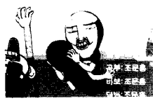
그림8. 홍스구락부 (롤링형태)

플래시 애니메이션 오프닝의 제목은 영화 내용에 맞게 특수하게 제작 할 뿐만 아니라, 크레딧의 다양한 서체 활용까지 세심한 제작이 이루어지고 있는데 그것은 크레딧이 정보전달 뿐만 아니라 시각적 효과도 주기 때문이다. 단순히 플래시 애니메이션 제목이 애니메이션 주제를 알리는 정보 전달의 역할을 넘어 시청각적 표현의 한 수단이 되고 있다.