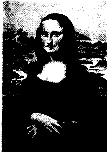
사진2. 「L.H.O.O.Q.」 1919, 19.4×12.2cm 연필과 레디메이드

「모나리자」로 대표되는 고전미술은 더 이상 난공불락의 요새도, 절대미의 영역도 아니며, 순수미술이 지녔던 독자성은 이제 일상성의 영역과 서로