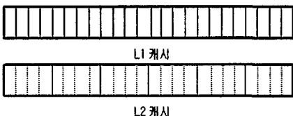
(그림 1) 2단계 캐시의 구조

2단계 캐시의 개념적인 형태는 (그림 1)과 같으며 L2 캐시는 작은 블록들이 특정된 큰 블록에 속해 있는 형태로 그 블록이 교체될 때까지 존재한다[5].