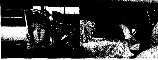
<그림 3> 슬라이드엿 시트 탑승 및 작동 모습

사고를 원인별로 보면, 기계의 불안정한 상태와 인간의 불안정한 행동, 또는 두 원인의 결합 등의 세 요인으로 볼 수 있다. 이들 요인중 기계와 인간의 결합요인으로 인한 불안정한 상태가 기계사고의 주요 요인이 되고 있다.