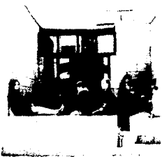
<그림 4-1> 몬테소리 스쿨 입구(헤르만 헬츠베르하)

구조주의 건축가들은 명확히 정의된 매개공간에 의해 어떤 것에서 다른 것으로 이동해 가는 것을 공간적으로 표현하는 동시에 이동 전후 공간의 존재의의까지도 환기시키려고 했다. 즉, 상반된 양극성을 화해 시키기 위한 것으로 외부에서 내부로 전이되는, 혹은 그 반대의 경우가 행해지는 입구역역과 기능적으로 분리된 공간을 자연스럽게 연결시키는 중정, 그리고 내외부의 공간적 관입을 가능하게 하는 테라스로 표현하고 있다.