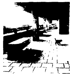
<그림 4-2> gallery-street (헤르만 헬츠베르하)

사용자나 보행자를 적극적으로 실내공간으로 유도하기 위한 개념으로 단순한 복도의 개념보다는 그 공간에 생명력을 부여하는 장치로서의 공간이다. 건물 안의 내부가로는 집밖의 가로를 내부에 연장하는 개념으로 건물내부에 외부의 가로공간을 만들어 건물 속의 도시를 실현한 것이다. 이 공간은 주로 기둥을 사용한 필로티로 처리되며 내부공간임에도 불구하고 외부공간의 요소들 즉, 가로등이나 상점, 은행 등을 내부에 배치함으로써 내향적인 성격을 지닌 공간으로서 내부와 외부라는 상반된 개념을 동시에 포함하고 있다.