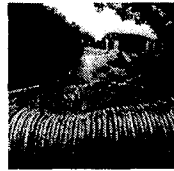
<그림 5> 히로시 데시가하라, 1997