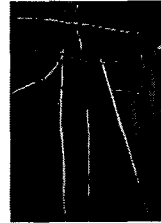
<그림 6> 요이치 히나타, 1988