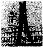
<그림 2> 올덴버그, 빨래집게, 1976, 필라델피아 센터스퀘어

록 하였다. 미국적 팝아트의 모습은 도시적이고 대중문화의 단면을 보여주는 양상으로 전개되었다. 그러나 팝아트의 작가들이 팝아트의 가치를 주장한 데로 현대인의 삶의 모습에 예술표현으로서의 가치를 부여하고자 했던 점에 중점을 둔다면, 다양한 배경과 발전단계를 갖는 각 문화권의 모습에 따라 팝아트의 표현양상은 다양한 모습으로 표현될 수 있다. 따라서 팝아트가 각 문화에서 흔히 발견되는 일상의 이미지나 물체를 미술작품으로 전환시키는 것을 목표로 하며 이를 통해 예술과 삶의 경계를 없애고자 하였다. 시가를 넓히면, 팝아트의 표현양상은 각 지역과 문화별로 다양하게 전개될 수 밖에 없다.