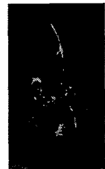
<그림 4> 플로라 & 카사바, 1990

을 대나무 설치를 통해 강조하고 있으며 이것은 작품 주위에 있는 수면의 아름다움과 대비되면서도 조화를 이루고 있다.