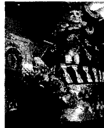
<그림 1> Red Grooms, Philadelphia Cornucopia, 1982. Institute of Contemporary Art, University of Pennsylvania에 설치

는 작가로 알려져 있다. 그의 작품은 거대한 스케일과 어릿광대 같은 분위기로 제작된다. 관객들은 이 작품 속을 걸어 다니며 관람하게 되어 있으며 작가는 이런 과정을 통해 감상자들이 이들 인물들과 개인적인 상호작용을 가지도록 유도하였다. 2)