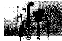
<그림 7> 데시가하라 소후, "車.2", 1951