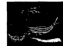
<그림 9> 이미립, 아깁 없이 주는 나무-떠나가는 배, 1999