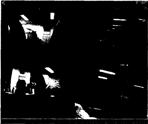
그림 2 클라이언트 실행 화면

실험결과는 사용자가 20명 이상이 들어가서도 실시간으로 모든 카메라에서 보내주는 영상을 받아들일 수 있었으며, 따라서 감시 시스템으로서의 역할로 별 손색이 없었다.