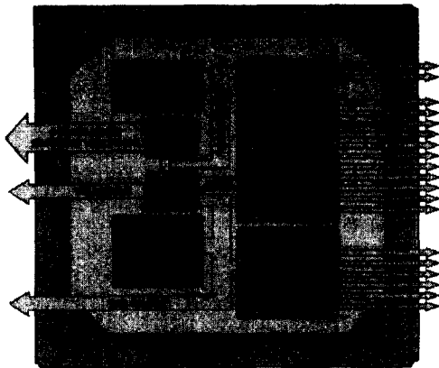
그림 3 ZFx86 CPU 블록도

네 번째 부분은 알고리즘 수행부분으로써 다음의 그림 3에서 소개하고 있는 x86계열의 ZFx86 CPU를 이용하여 플래시 메모리나 일반 하드디스크 드라이브에 저장되어 있는 Embedded Linux 기반의 영상처리 알고리즘을 수행하게 된다.