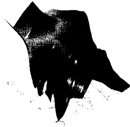
그림 4: 3D surface 렌더링 결과