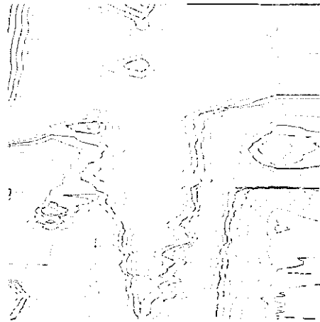
그림 3: 그리드 데이터로부터 생성된 등고선

본 연구는 DEM으로부터 추출된 등고선 데이터를 이용하여 3차원 지형 가시화하는 방법을 소개하였다. 등고선 레이어의 일부 등고선에 대해서만 근사화를 수행함으로써 계산량을 최소화할 수 있었다. 이렇게 구해진 근사된 점점들과 등고선 데이터를 입력으로 하여 제한된 델로니 삼각분할(Constrained Delaunay Triangulation)을 수행함으로써, 메모리 측면에서도 적은 량의 데이터로 3차원 지형을 가시화를 수행할 수가 있었다.