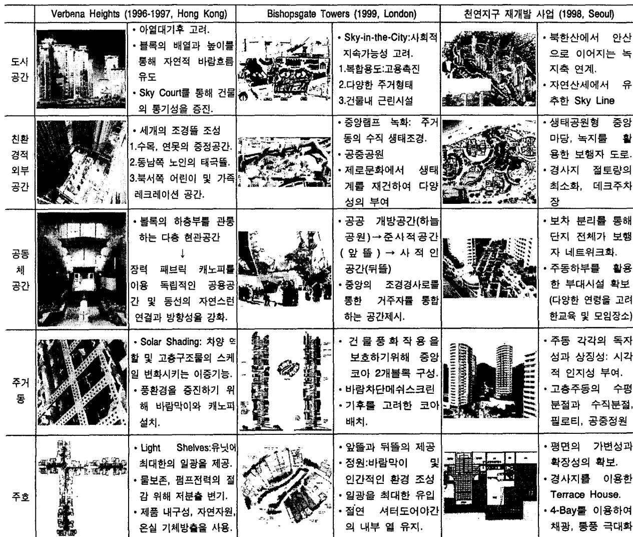
표3. 친환경주거 사례

해결할 수 있는 환경적 디자인 인자에 대한 고려가 주요한 설계요점이고, 또한 홍콩의 고 밀도 주거경향에 따른 고 밀도 고층주택으로 이루어졌다.