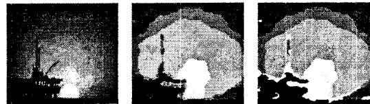
(a) 원영상 (b) Quantize 된 영상 (c) 영역추출

RGB, HSV 컬러공간에 대해 영상에서 일정 크기 이상의 영역을 차지 하는 컬러를 추출한다. 이 추출된 컬러 영역을 상하, 좌우 스캔하여 상대적인 컬러의 위치를 색인한다.