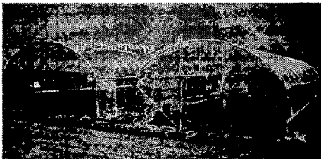
<그림 1> 답전윤환 시설 전경

주요규격은 표 1.과 같이 폭 6m, 측고 1.7m, 동고 3.2m, 길이 20m, 동간간격은 2m, 파이프로 \phi 25\text{mm} \times 1.5\text{t} 를 60cm 간격으로 동서방향으로 설치하여 시험을 실시하였다.