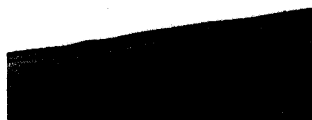
그림 5 X-TEM image for the typical surface defect