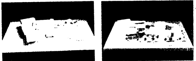
<그림 2> 인지도 형성을 위한 오픈링 스터디