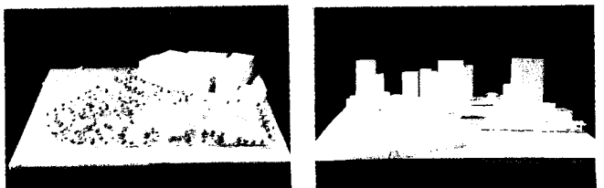
<그림 4> 'K'관광정보관의 외부공간