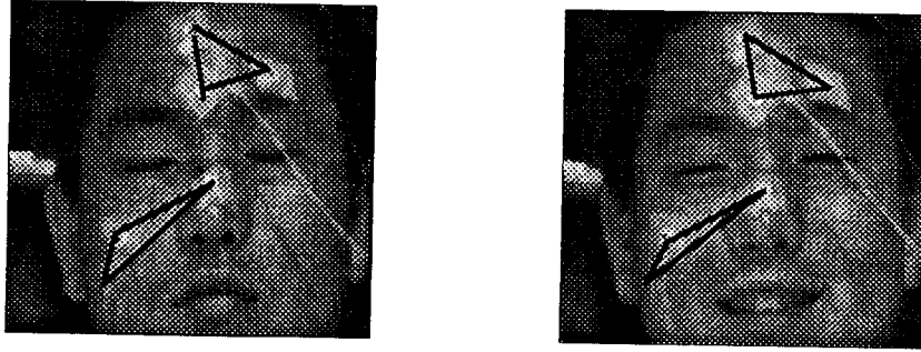
그림 1. 얼굴근전도 측정을 위한 전극 배치 및 무표정과 웃는얼굴