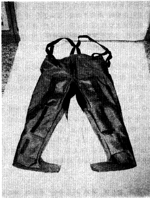
<그림 1 > 방석복 상하의의 개선안