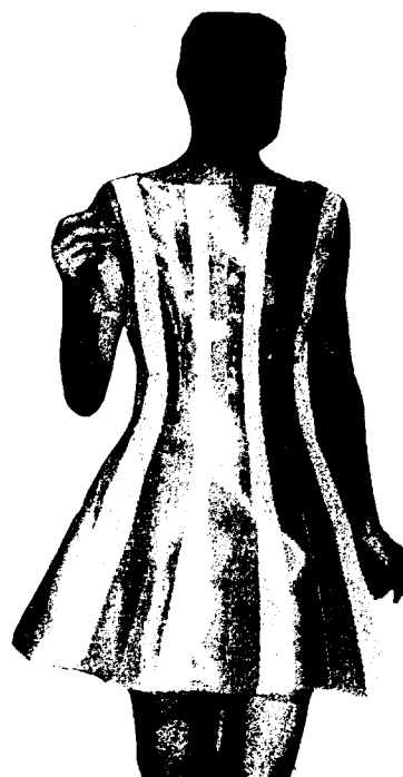
<그림 3> 영롱한 무지개 빛을 주제로 한 디자인