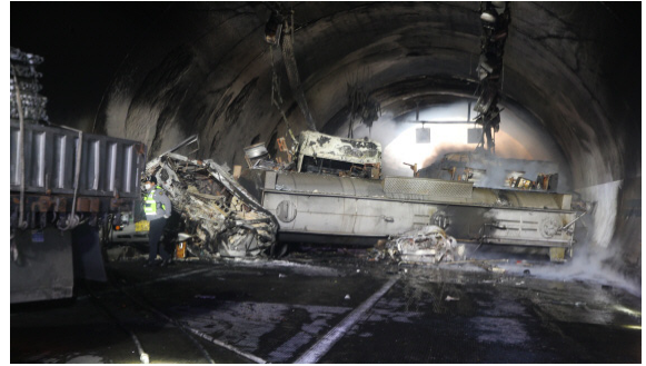
(b) Underground tunnel fire (Samae 2 tunnel, 2020)