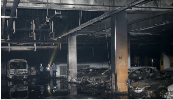
(a) Underground parking fire (Songdo, 2016)

간 평균 26건)의 사고가 발생하여 부상 14명, 재산피해 124억원이 발생하였다. 주차장의 지하화 및 지하터널의 확대 등을 고려할 때, 이에 대한 적극적인 대책마련이 요구될 것으로 판단된다.