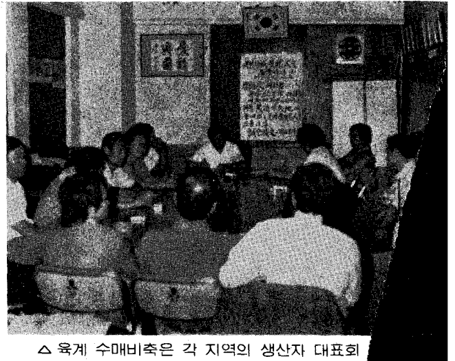
△ 육계 수매비축은 각 지역의 생산자 대표회의를 개최 물량을 배정하고 있다.

한편 대구 및 부산지역의 수매사업은 각각 본회의 경북지부 및 경남지부에서 물량 배정을 추진하고 있다.