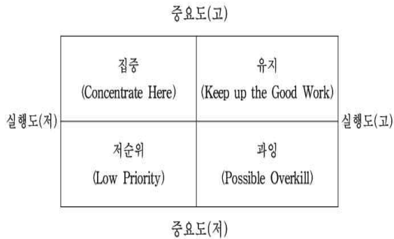
▶▶ 그림 1. 중요도-만족도 매트릭스

중요도-만족도 모형의 특성은 중요도와 만족도의 속성별 비교평가 값에 의하여 4가지의 다면적 의사결정을 내린다는 것이다. 중요도-만족도는 [그림1]과 같이 평가요소의 중요도(importance)와 만족도(performance)를 측정하여 2차원 도면상에 표시하고 그 위치에 따라 상대적인 의미를 부여한다.