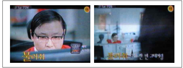
[그림 1] 연속성

[그림 1]에서는 폰트의 크기와 컬러 그리고 폰트의 종류를 달리 하는 방법으로 문장을 강조하며 흐름을 조절하고 있다.