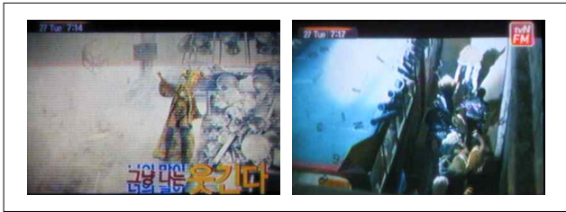
[그림 5] 역동성

기존의 자막이 긴 문장을 가로로 한번에 나열하는 방식이었다면 역동성을 보여주는 [그림5]의 경우에는 단어가 순차적으로 나타나며 그 메시지를 전달하는 방법에 있어 기존의 단어를 가로로 분할하며 등장하는 방식을 취하고 있다. 또는 등장했던 단어가 음률의 종료와 함께 폭발하는 형식을 취하며 사방으로 흩어지기도 한다. 이는 강력한 의지의 표현으로 보여 지거나 강인함을 나타내고자 하는 표현의 방식으로 볼 수 있다.