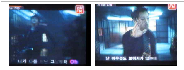
[그림 4] 잔상

느린 비트의 청각 효과에 텍스트의 잔상 효과는 애절함과 간절함을 더 해 준다. 페이드인 혹은 페이드아웃으로 가사의 내용을 더욱 강하게 호소할 수 있는데 페이드인인 경우는 애절함을 페이드아웃의 경우는 절망감을 표현하고 있다. 또 페이드아웃의 경우는 뮤직 비디오의 종료 또는 한 소절의 종료 그리고 기다림을 예고하기도 한다.