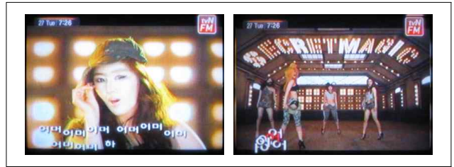
[그림 3] 반복성

후렴구의 반복은 기존의 자막에선 돋움체로 길게 반복되는 횟수만큼 나열되는 것이 보통이었지만 후렴구의 반복되는 단어를 운율에 맞추어 리듬감 있게 반복함으로써 귀여움과 발랄함을 전달한다. 또한 디지털음원의 빠른 비트는 단어의 겹침으로 표현하여