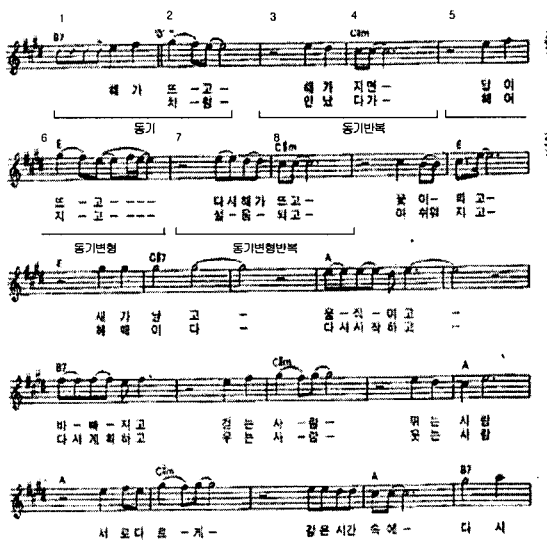
그림 1. 들국화의 “돌고 돌고 돌고” (일부)

그림1은 들국화의 “돌고 돌고 돌고” 악곡의 일부분이다. 그림1의 1, 2마디의 선율이 3, 4마디에 반복되어 나타난다. 또한 1, 2마디의 선율이 일부 변형되어 5, 6마디에 나타나고, 이것이 다시 7, 8마디에서 반복된다.